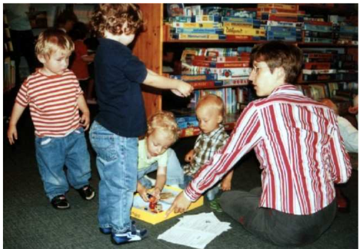
Spielkreis-Besuch 2007: Die Entdeckung der Spielecke