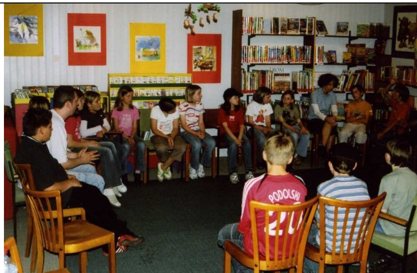
Gruselige Lesenacht 2007: Leserunde

Thematisch stehen Gespenster und Geister im Vordergrund, d.h. die ausgewählten Vorlesegeschichten entstammen Gruselbüchern. Daneben stehen Basteln, eine (gut zweistündige) Gespenster-Nachtwanderung (mit Gang über den Friedhof zur Geisterstunde) und ein Gruselquiz auf dem Programm, das durch den Besuch eines „prominenten Vorlesers“ (i. d. R. der Bürgermeister) abgerundet wird, der natürlich auch Gespenstergeschichten mitbringt und sich anschließend den Fragen der Schüler/innen stellt. Die Nacht wird – je nach Müdigkeitsgrad – schlafend oder lesend (mit Taschenlampen) in der Bücherei zwischen den Regalen verbracht. Ein gemeinsames Frühstück mit der Auflösung des nächtlichen Gruselquiz und der Überreichung von Teilnehmerurkunden schließen die Lesenacht ab.