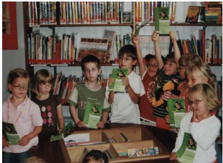
Bibfit: Erhalt des „Bibliotheksführerschein“ zum Abschluss der Aktion