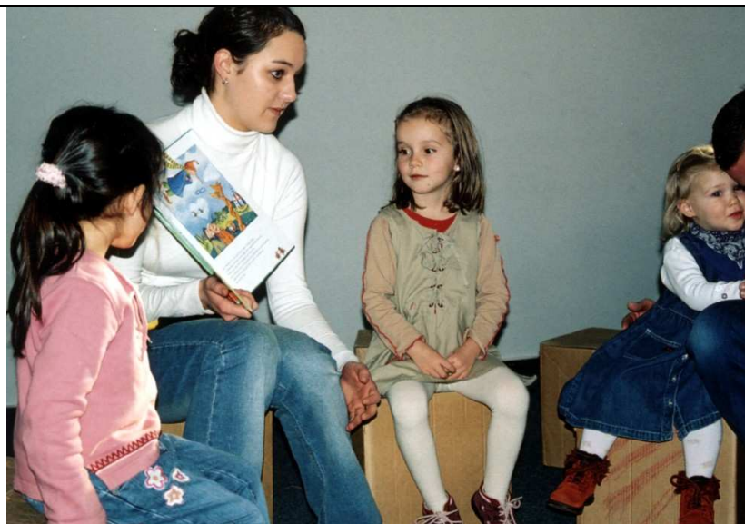
Szene aus einem Vorlese- Vormittag 2005

Neben dem „reinen“ Bilderbuch-Vorlesen werden auch Bilderbuchkinos, Kasperletheater oder auch ein „musikalisches Erzählen“ mit Instrumenten (durch das Team der musikalischen Früherziehung des örtlichen Turnvereins) angeboten.