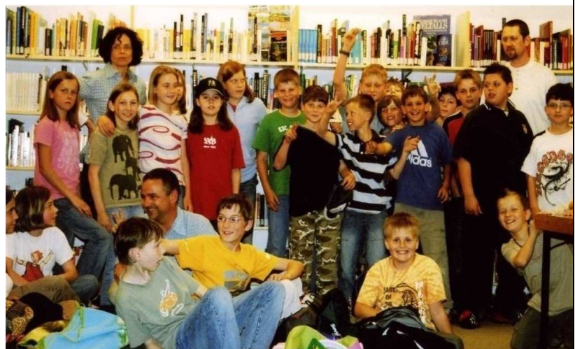
Gruselige Lesenacht 2007: Gruppenbild mit Bürgermeister