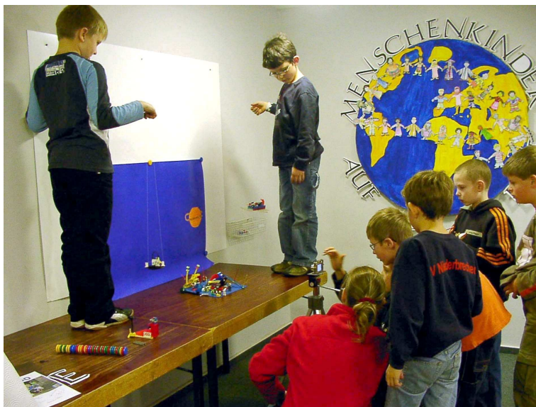
Trickfilm-Workshop 2005: Die Verfilmung einer selbst geschriebenen Buches